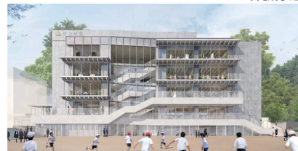
校舎完成イメージ図:現在、設計段階のためデザイン等大幅に変更となる可能性があります。

理科室・音楽室・図書室・カフェテリアなど生徒みんなが使える多目的棟を建設中です。期間中は隣接するグラウンドが使用できないため、別校舎(鷹ノ宮校舎)で体育を中心とした授業を週1回おこなっています。