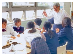
〈写真〉 昨年のワークショップ

国語科教科書に再録されていた「転校生が来る」を含む、対話劇と宝仙祭(文化祭)に向けた演劇に関するワークショップ。