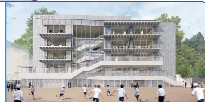
100周年記念事業 新校舎建設(一部) 2028年3月完成予定

学校法人宝仙学園 順天堂大学系属理数インター中学校・高等学校 HOSEN GAKUEN JUNIOR & SENIOR HIGH SCHOOL